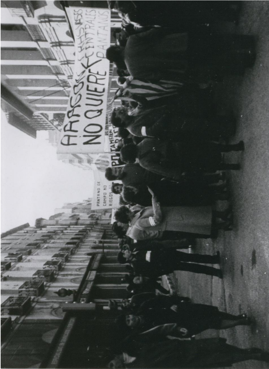
Figure 4. Archivo Andalán. "Campo". Puede leerse "Aragón no quiere pantanos, trasvase, centrales."