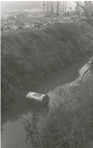
Figura 2. "Valdefierro. Contaminación"