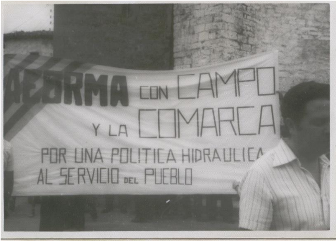
Figura 1. "Campo"