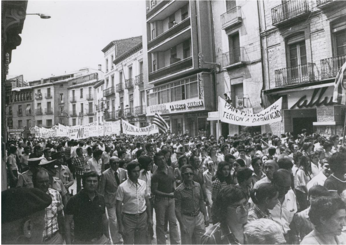
Figura 5. Archivo Andalán. "Huesca. Manifestación" Motivo: "por una gestión democrática de los recursos naturales"