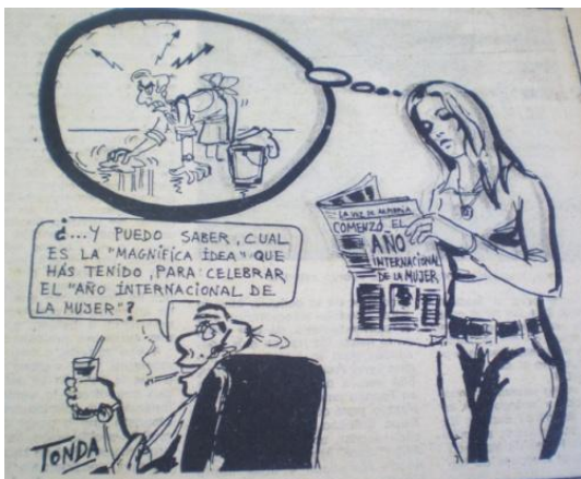
Fig.12, La Voz de Almería , 28.2.1975