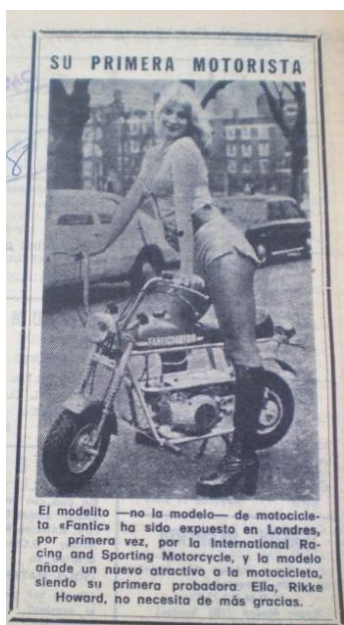
Fig.3, La Voz de Almería , 8.1.1975

A partir del mes de abril de 1975, La Voz de Almería incorporó a la sección diaria de entretenimiento la tira humorística “Adán y Eva” en la que se contaban las aventuras de un Adán picarón deseoso de acercarse a una Eva voluptuosa y muy sensual (Fig.4).