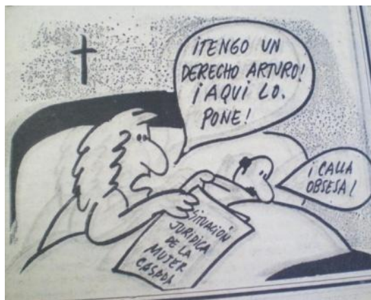
Fig.17, La Voz de Almería , 14.8.1975