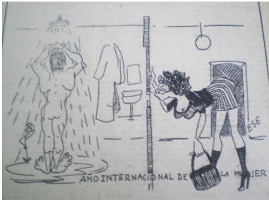
Fig.14, La Voz de Almería , 24.4.1975