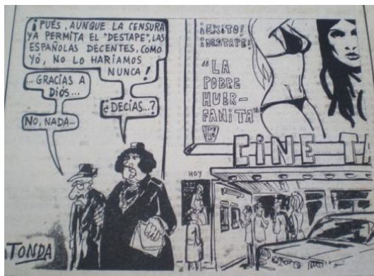
Fig.8, La Voz de Almería, 1.4.1975

Un ejemplo más interesante lo muestra la figura 9. En esta viñeta de Edu también aparece el destape, aunque consideramos que la crítica va más bien encaminada hacia aquellos intentos “erróneos” de realización de la mujer. Como en otras viñetas que veremos más adelante, se transpira una cierta ridiculización de las reivindicaciones de la mujer. Pero, a pesar de ello, es muy interesante la crítica al discurso qué consideraba el destape como un paso decisivo de la mujer hacía la liberación y la modernidad.