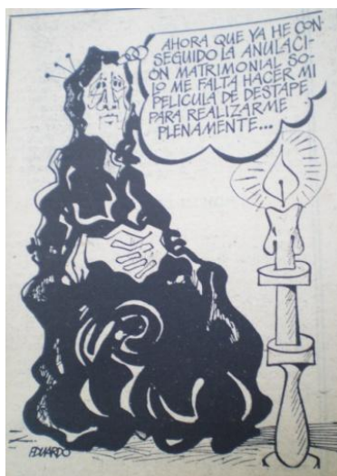
Fig. 9, La Voz de Almería, 28.11.1975