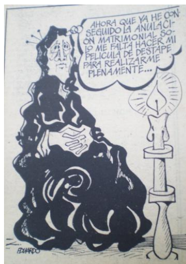
Fig. 9, La Voz de Almería , 28.11.1975