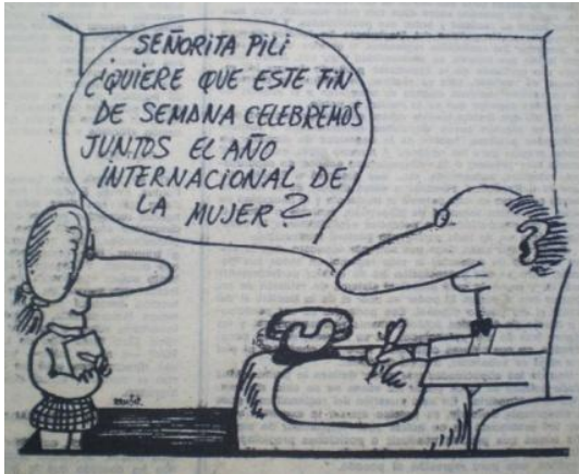
Fig.19, La Voz de Almería , 1.2.1975