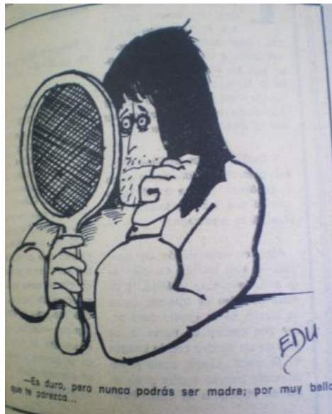
Fig.1, La Voz de Almería , 30.5.1975