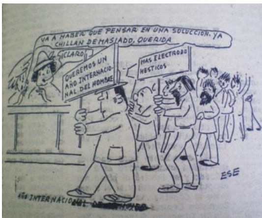
Fig.16, La Voz de Almería , 30.5.1975