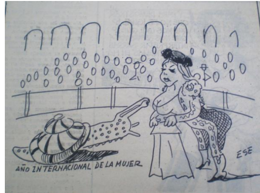
Fig.15, La Voz de Almería , 15.10.1975