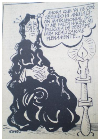
Fig. 9, La Voz de Almería , 28.11.1975