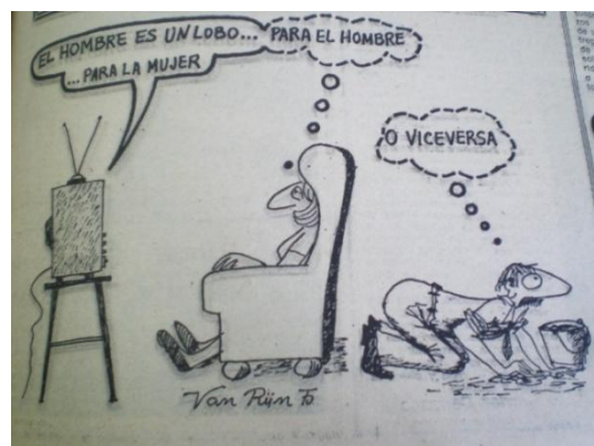
Fig.13, La Voz de Almería , 3.6.1975