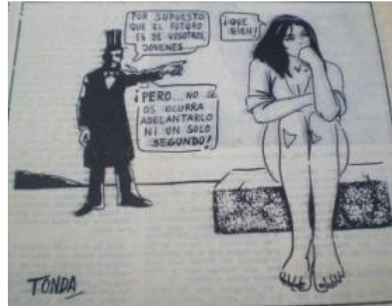
Fig.20, La Voz de Almería , 6.2.1975