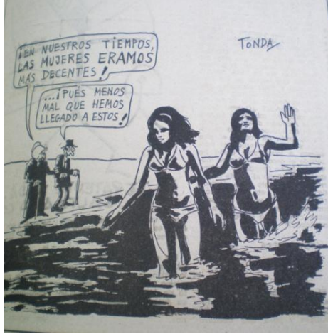
Fig.7, La Voz de Almería , 26.3.1975

estos autores ninguna crítica al destape, sino en todo caso, una ridiculización de aquellas mujeres arcaicas que no lo aceptan.