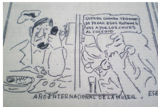
Fig.11, La Voz de Almería , 15.7.1975