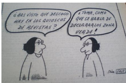
Fig.5, La Voz de Almería , 30.5.1975