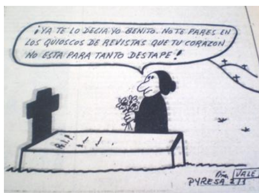
Fig.6, La Voz de Almería , 30.5.1975