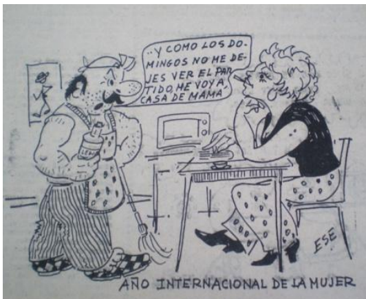
Fig.10, La Voz de Almería , 12.4.1975

Ya hemos visto en apartados anteriores algunas viñetas aparecidas a lo largo del Año Internacional de la mujer en el periódico La Voz de Almería . De las 30 viñetas que encontramos, unas 20 tratan directamente el Año Internacional de la Mujer o algún aspecto de las reivindicaciones feministas. Otras seis tienen por tema principal el destape y el resto son ejemplos particulares, que por únicos no se han clasificado. Agrupando el grueso de viñetas, dedicadas al año Internacional de la mujer hemos observado la existencia de un esquema simple y repetitivo que resume el punto de vista de los autores.