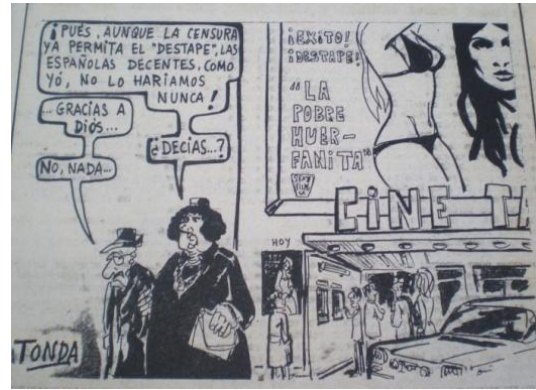
Fig.8, La Voz de Almería , 1.4.1975

Un ejemplo más interesante lo muestra la figura 9. En esta viñeta de Edu también aparece el destape, aunque consideramos que la crítica va más bien encaminada hacia aquellos intentos “erróneos” de realización de la mujer. Como en otras viñetas que veremos más adelante, se transpira una cierta ridiculización de las reivindicaciones de la mujer. Pero, a pesar de ello, es muy interesante la crítica al discurso qué consideraba el destape como un paso decisivo de la mujer hacía la liberación y la modernidad.