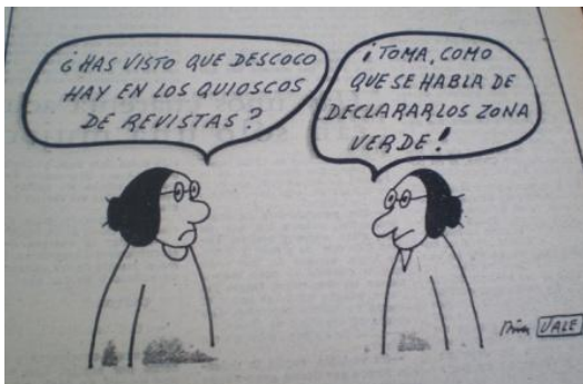
Fig.5, La Voz de Almería , 30.5.1975