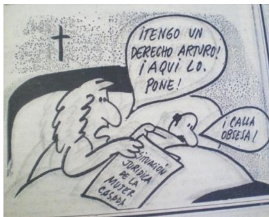
Fig.17, La Voz de Almería , 14.8.1975