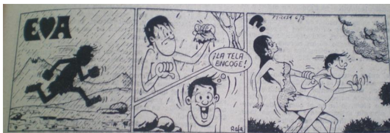
Fig.4, La Voz de Almería , 26.6.1975