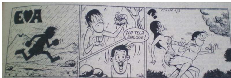
Fig.4, La Voz de Almería , 26.6.1975