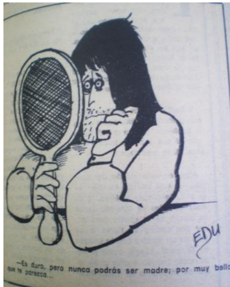
Fig.1, La Voz de Almería , 30.5.1975