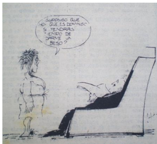
Fig.2, La Voz de Almería , 27.4.1975

Que la mujer debía ser ante todo bella lo recuerdan no sólo los cursos organizados por la Sección Femenina y las Amas de Casa, sino también las continuas referencias en La Voz de Almería a los encantos femeninos , tanto en los artículos que tienen por tema la igualdad de la mujer cómo aquellos que informan del enésimo certamen de belleza.