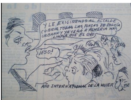
Fig.18, La Voz de Almería , 7.6.1975

Sorprende que hasta el momento no hayamos hecho referencia a ninguna viñeta que reivindicara las injusticias y desigualdades a la que estaba sometida la mujer. Por desgracia tenemos que afirmar que esto se debe a que no hemos encontrado prácticamente ninguna. De las 30 viñetas, tan sólo dos podrían simbolizar una ligera crítica a las injusticias (Fig.19 y 20). En la primera viñeta un jefe descarado le propone a una chica, caracterizada como una niña, la celebración del Año Internacional de la Mujer. Aunque no podemos afirmar que el lector de su momento entendiera la viñeta como una crítica a la manipulación del Año Internacional de la Mujer, si queremos destacar esa posible lectura. En cambio, el segundo ejemplo no trata directamente el tema de la mujer, es más bien una reivindicación de libertad y de la juventud, ideas constantes en las viñetas de Tonda. A pesar de ello nos parece significativo que se haya elegido a una mujer para representar a una juventud oprimida.