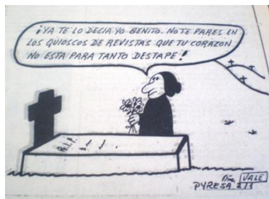
Fig.6, La Voz de Almería , 30.5.1975