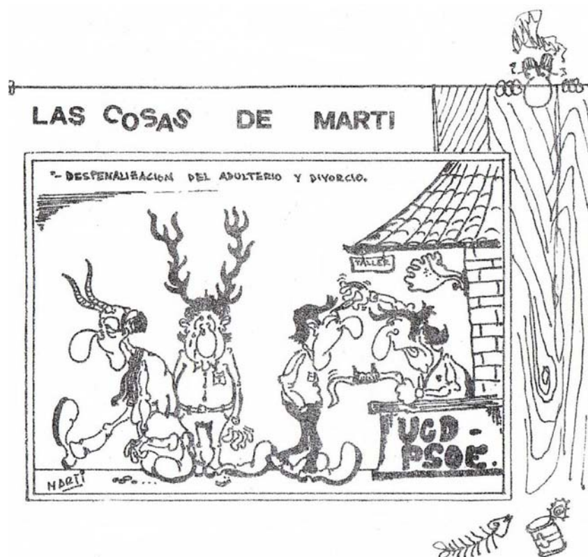
Ilustración aparecida en el Boletín Tradicionalista Siempre en su número 3 de 1982.

temerosa, consienta a ello a cambio de conservar sus posiciones económicas, como sucedió desde 1833 a 1936. ¿Quién será entonces responsable ante Dios de la condenación de muchas almas y de la sangre de muchos no nacidos?” 8